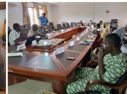
Maire/Bassila qui préside sa session