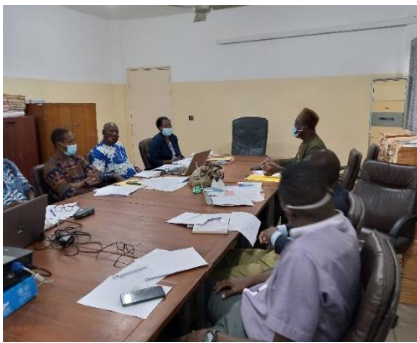
Troisième Adjointe Maire/Cotoou préside sa session