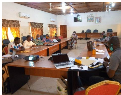
DAM/Klouékanmé au centre qui préside sa session