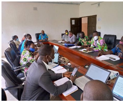
SG/Ouinhi qui préside sa session