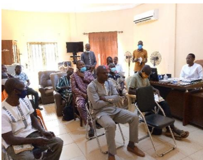
Maire/Kérou en blanc préside sa session