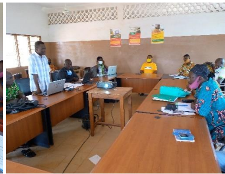
Maire/Toviklin en jaune qui préside sa session